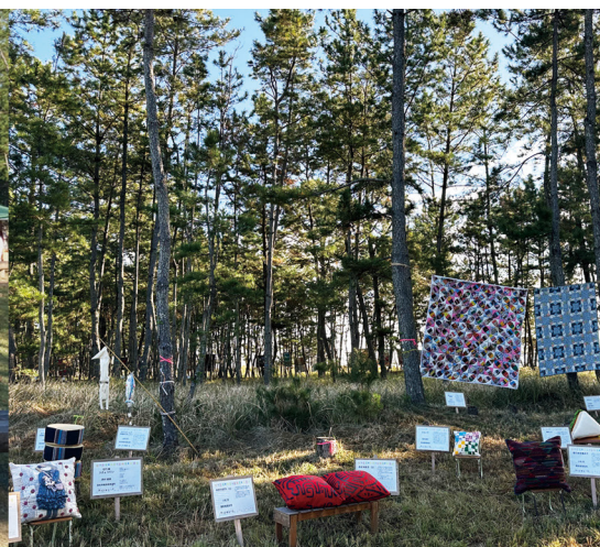
今ここで、松枯れの問題がおきています。「入野松原」という作品を守るために美術館としてできることは?『潮風のキルト展』を楽しみながら「松原のメッセージ」も発信します。