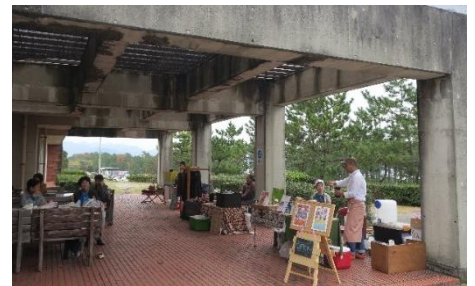
→ 火気を使用の場合は屋外テラスでの出店となります。