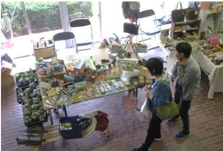
← 屋内の出店の様子。